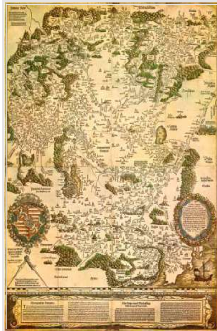
Слика 5. Лазарева карта Угарске.