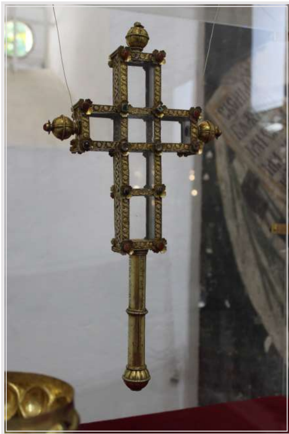
Слика 10. Крст манастира Моштанице.