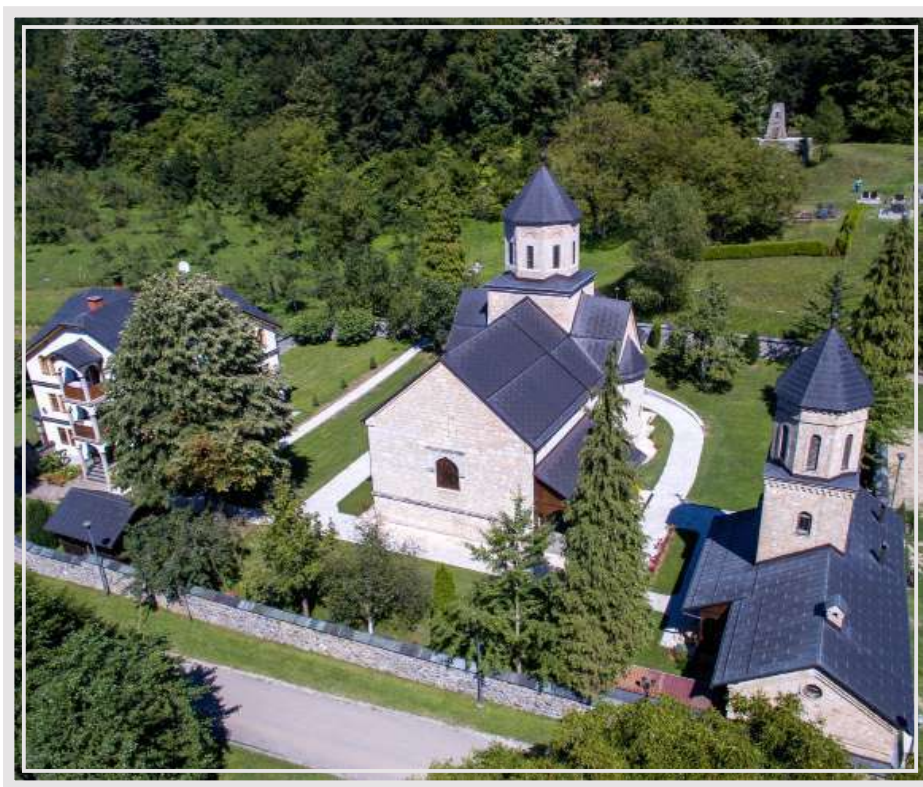
Слика 1. Комплекс манастира Моштанице, фотографија из 2016. године.

Манастир Моштаница налази се у селу Горњоселцима, у општини Козарској Дубици, која се некад звала Дубица, па Турска Дубица, а онда и Босанска Дубица. Ово мијењање имена једне пограничне вароши последица је честих историјских помјерања граница: од друге половине 15. вијека, када је краљевина Угарска, последије пропасти Босне 1463. године, преузела њене сјеверне дијелове од Турске и створила Јајачку и Сребреничку бановину, па до друге половине 19. вијека, када су по одлукама Берлинског конгреса (1878) турске покрајине Босна и Херцеговина ушле у састав Аустроугарске монархије, овај дио Босанске Крајине, гдје се налази Моштаница, равно је десет пута прелазило из једне државе у другу.