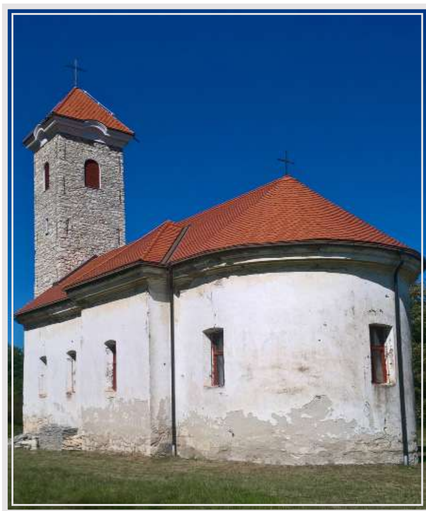
Слика 9. Манастир Комоговина на Банији (некадашња Војна Крајина), фотографија из 2017. године.

„Тај се манастир налази у Банији, у горњо-карловачкој епархији. Осниваоци му беху јеромонаси: Јован Свилокос и Силвестар Продановић, који су амо дошли из босанског манастира Моштанице, и саградили 1613. године цркву комоговинску, од камена са разваљене куле Змај Вука Бранковића (1482–1485)” (Красић, 1889, стр. 6).