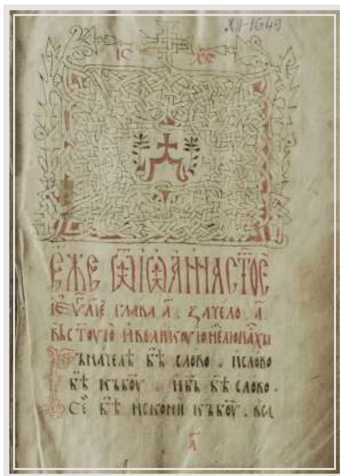
Слика 8. Јеванђељја Васкрсења , 1607. „Јеже от Јоана Светое Евангелије”.