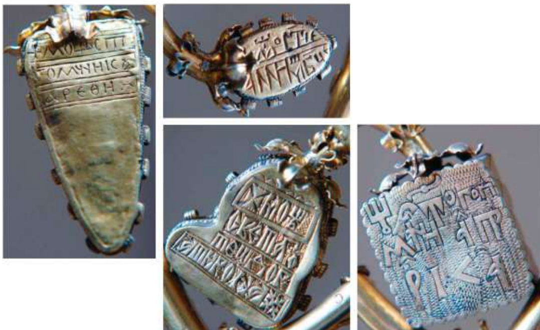
Слика 4. Мошт светог мученика Арете, мошт свете Ане, матере Богородице, мошт светог Теодора Тирона и мошт светог Данила пророка.

Овај култни религијски предмет данас је познат под именом „Реликвијар Барбаре Франкопан”, а чува се у Фрањевачком самостану Св. Марије на Трсату код Ријеке (Хрватска). Премда је Барбара у потписима на три оковане мошти са поштовањем истицала свој статус српске „деспотице”, овај моштаник је касније добио не само латински назив „реликвијар”, уз изостављање Вуковог имена, већ и тумачење да је намјенски прављен за поменути католички самостан. Са друге стране, његов српскословенски назив – моштаник (уз који је почетком 17. вијека забиљежен и облик у женском роду – моштаница) пренијеће се на име манастира (посвећеног св. Арханђелу Михајлу), а потом и на име рјечице уз коју је манастир саграђен.