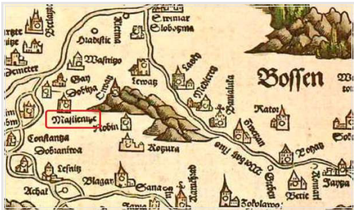
Слика 6. Исјечак из Лазареве Карте: Mastienize.