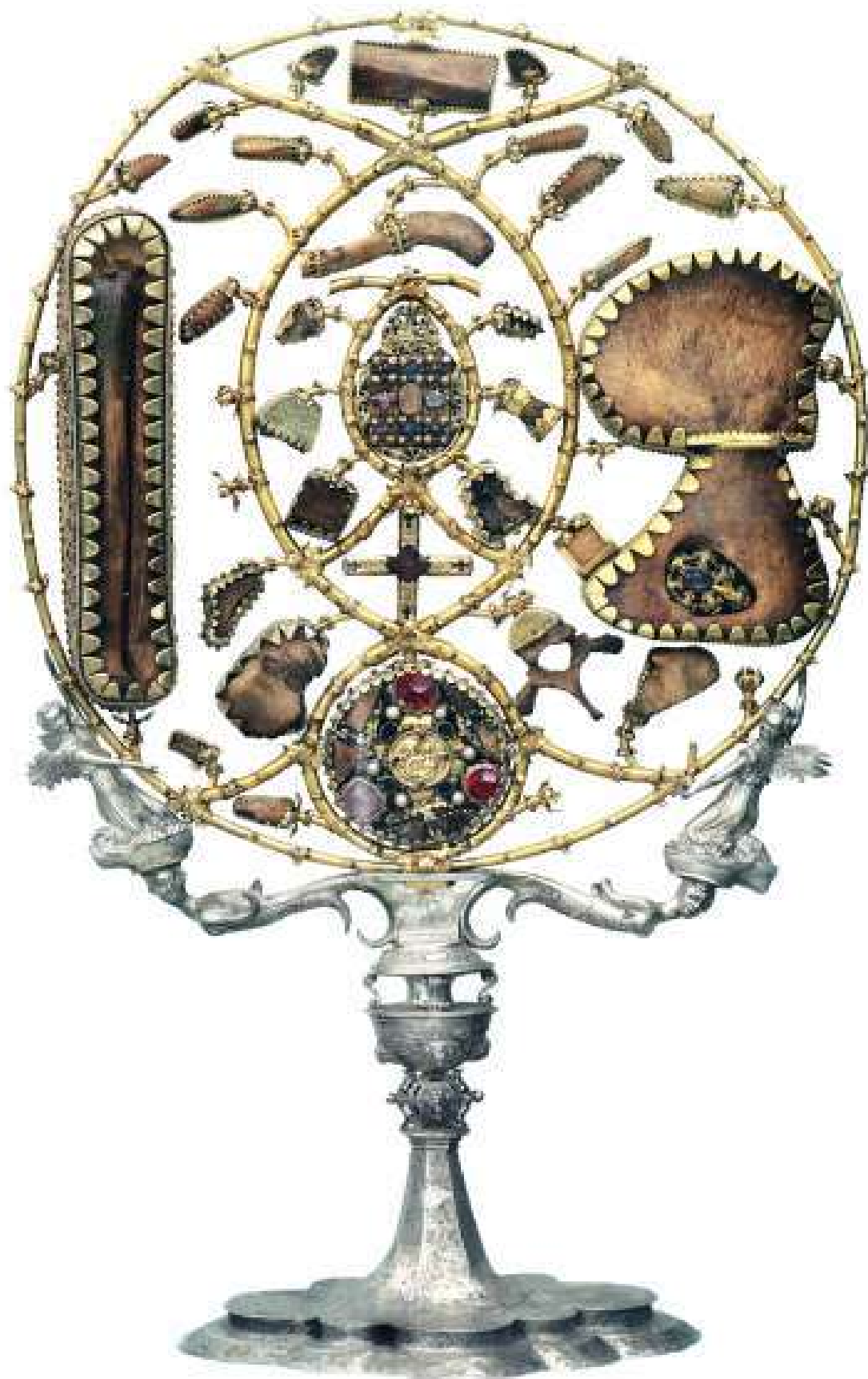
Слика 3. Моштаник деспота Вука и деспотице Барбаре.