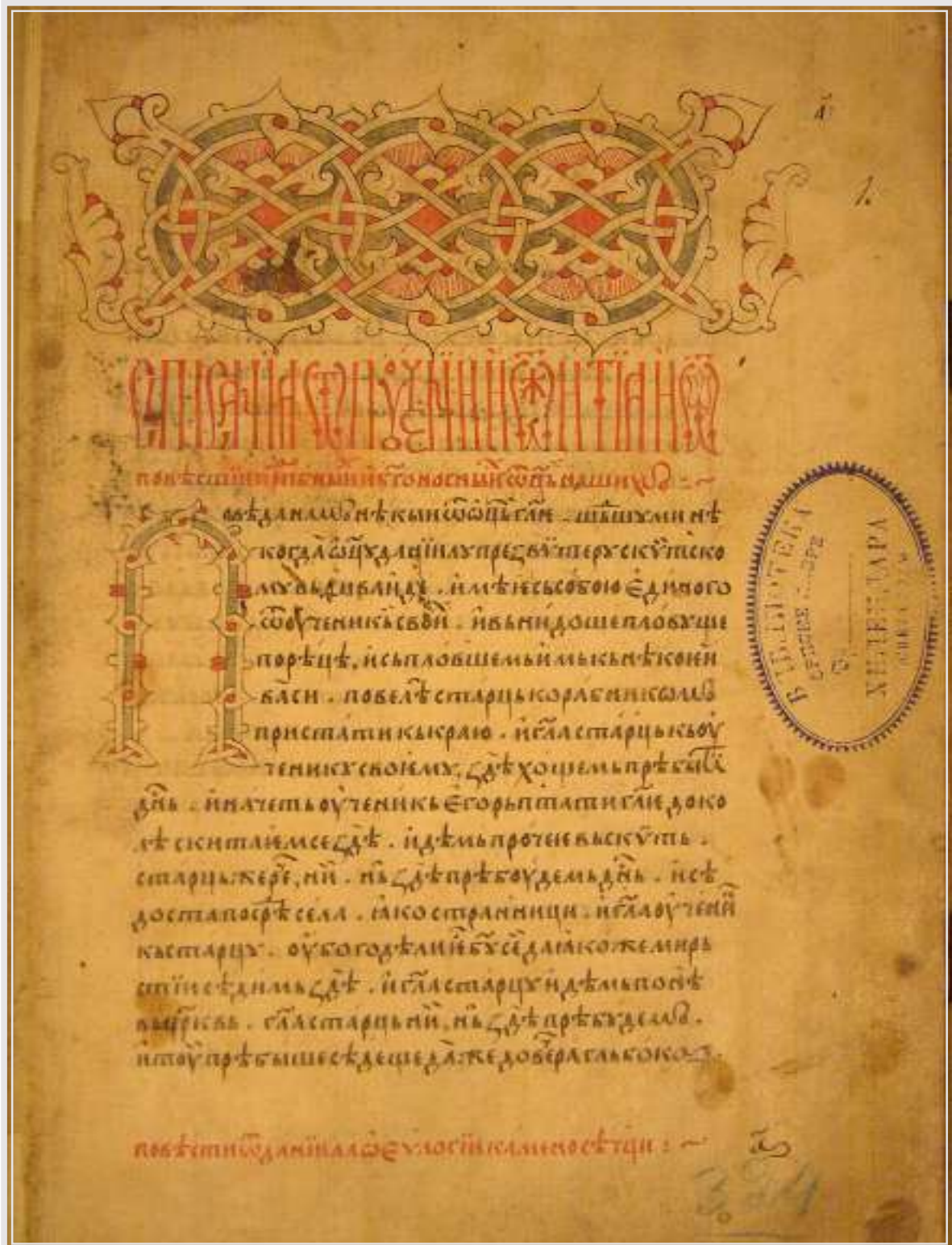
Слика 7. „Списаниа от поучении от житиа и от повести преподобних и богоносних отаца наших”.

италијански картограф Росели (Francesco Roselli), и то између 1478. и 1484. године. Пошто он тај посао није завршио до краја, на његово мјесто је доведен Лазар (мађ. Lázár, лат. Lazarus Secretarius), који је многе податке преузео од Роселија, али и сâм је око 1510. године радио на терену. Карта је први пут одштампана у Инголштату 1528. године, а наш топоним је записан у облику: Mastienize.