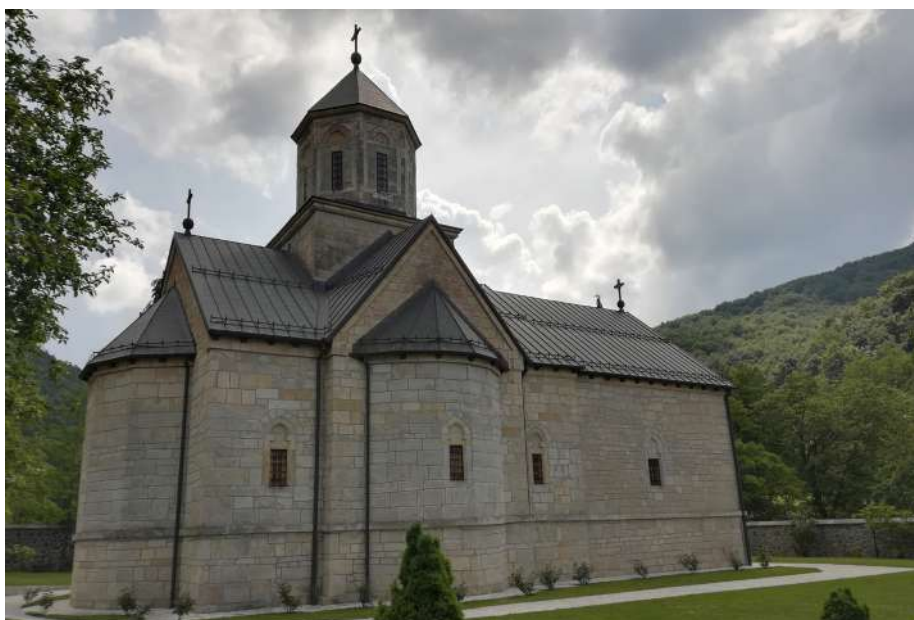
Слика 6. Моштаничка црква, поглед са сјевероистока, фотографија из 2020. године.

То стремљење ка небу неимар је укрстио са три кордонска вијенца, од којих данас постоји само један – средњи, који се налази на висини 2,1 м од земље. Онај горњи, на 4,6 м, био је дјелимично сачуван све до последње обнове у XIX вијеку, што се може видјети на јединој фотографији из 1882. године; данас се познају само његови трагови, што је случај и са доњим вијенцем који је био на 1,2 м од земље.