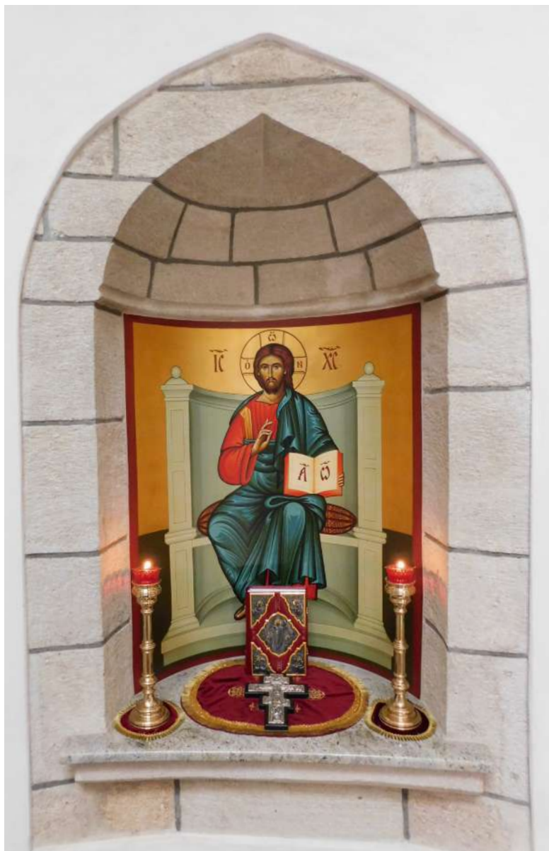
Слика 5. Горње мјесто (овална ниша у апсиди).

леђа. 4 Трећа ниша истог облика, само мањих димензија (1 / 2 / 0,5 м), налази се на средини олтарске апсиде, изнад тзв. горњег (високог) мјеста.