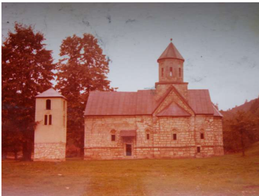
Слика 1. Манастир Моштаница, фотографија из 1976. године.

У тим несигурним временима, на исто тако немирним просторима, почетком осме деценије XV вијека подигнута је црква манастира Моштанице, посвећена Св. Арханђелу Михајлу.