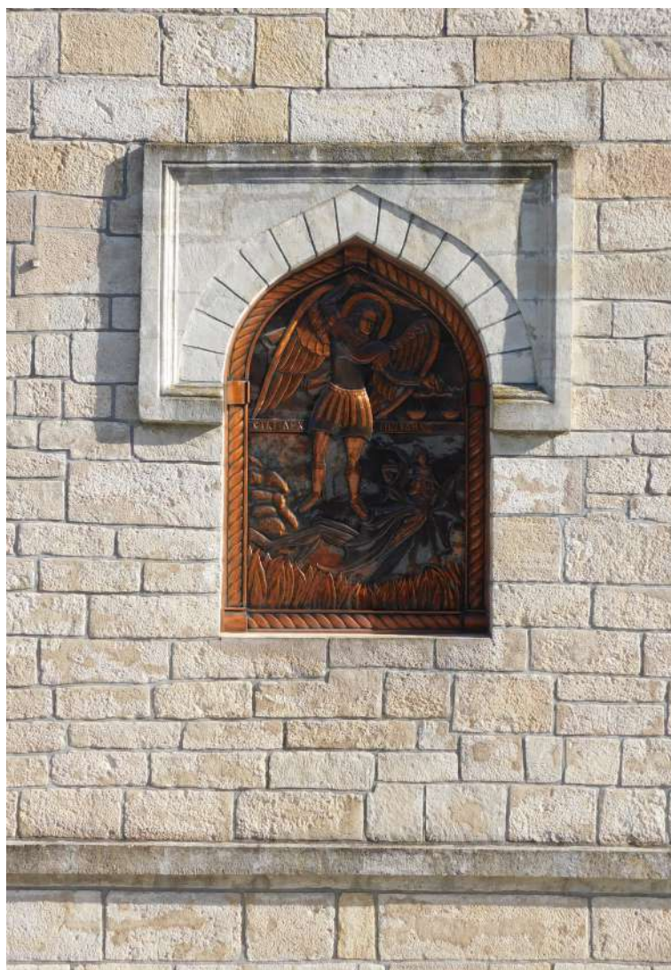
Слика 8. Ниша на западном зиду, фотографија из 2021. године.

Уздигнута 3,30 м од земље, одмакнута по 4,3 м од лијевог и десног угла припрате, а 5 м удаљена од врха кровног вијенца, ова композиција је постављена не у геометријски центар, већ у средиште обичног људског погледа. Не само због своје издужености и висине већ и због врха свог седластог лука, од ње се тај поглед, природно и лако, креће по вертикали према кровном сљемену, на којем се налази западни манастирски крст. Зависно од тачке гледишта, изнад се може видјети и купола са великим крстом, а изнад њих – небо. Тако је ова композиција, иако у цијелости видљива и блиска људском оку, ипак остала узвишена (као на каквом постаменту) и недодирљива људској руци. Имајући на уму да је на њој и прије био приказан Св. Арханђел Михајло, који пламеним мачем убија ђавола и баца га у пакао, можемо само да замислимо какав је утицај и колики значај, како својим необичним обликом тако и снажним и потресним садржајем, она имала за средњовјековног човјека.