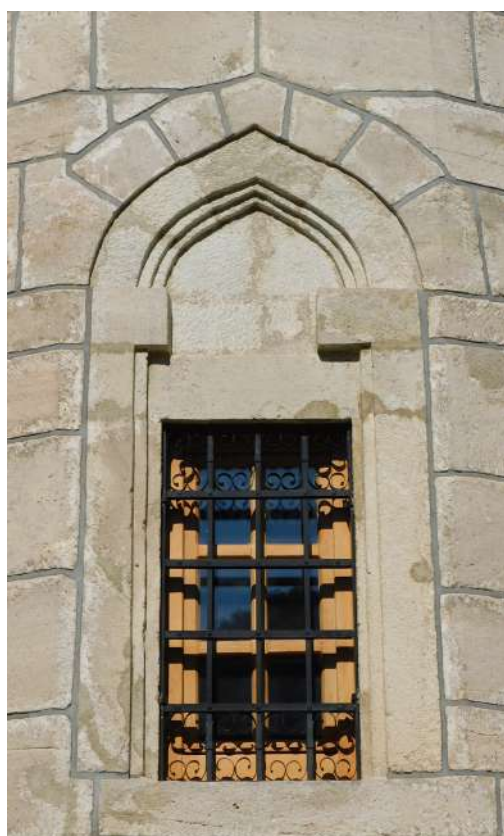
Слика 4. Јужни прозор на централном травеју.

Посебност ове манастирске цркве чине нише или удубљења; оне су или плитко упуштене у зиду (тад су дводимензионалне) или су овално удубљене, увучене у зидну масу (тродимензионалне). Разликују се и по облику лука као и по величини. У олтарском травеју има их шест. Највеће од њих су двије које су полукружно удубљене у зидну масу (димензије ширине, висине и дубине: 1,50 / 3,45 / 0,70 м), а налазе се са лијеве и десне стране олтарске апсиде те са њом „дају слику трочланог олтара“. Њихов овални облик (попут конхи) на врху се завршава полукалотом чији је завршетак урађен у облику седластог лука или магарећих