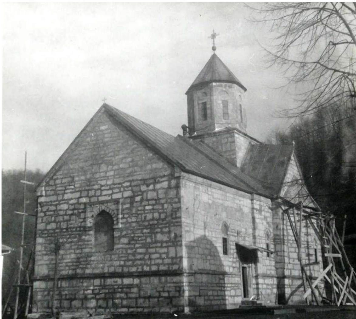
Слика 7. Западни зид, фотографија из времена обнове крова 1975. године.

Знакове еклектизма неимар је показао и у изведби нише на западном зиду храма. Ријеч је, у ствари, о дводијелној композицији коју чине ниша и правоугаоник. Ниша је упуштена (15 цм) у зидну масу са два плитка степеника, а правоугаоник је издигнут изнад зида и оивичен са три вијенца, од чега су два унутрашња полукружног пресјека, а трећи, највећи, квадратног. Облик нише је исти као и у манастирских портала и прозора, само је она већих димензија (ширина јој је 1,6 м а висина са луком 2,35 м), а правоугаоник је сличан ономе над главним улазом у цркву, само није уздужно, већ попречно постављен. Ниша се својом горњом половином, од упоришне тачке каменог лука (седластог облика), налази унутар тог правоугаоника (ширине 2,8 м а висине 1,8 м).